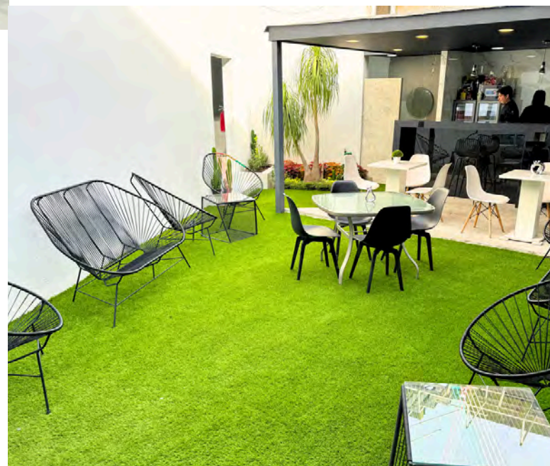
CAFETERÍA Y ÁREA DE DESCANSO

MODALIDAD 2 DIAS X SEMANA implantología: 1 Semana al mes